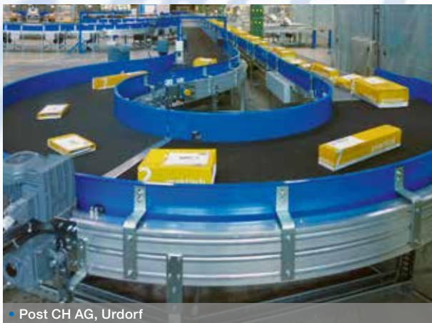
• Post CH AG, Urdorf