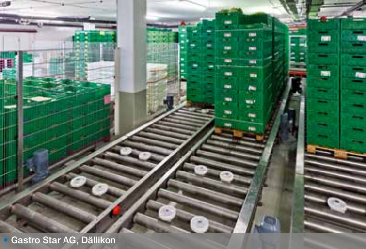
• Gastro Star AG, Dällikon