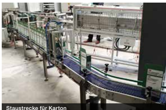
Staustrecke für Karton