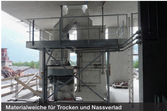
Materialweiche für Trocken und Nassverlad