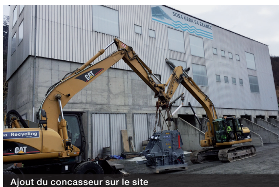
Ajout du concasseur sur le site