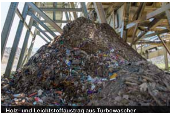
Holz- und Leichtstoffaustrag aus Turbowascher