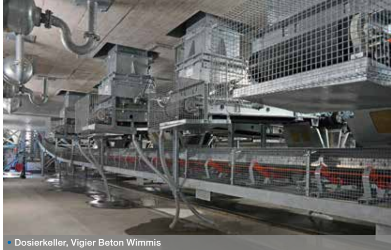
• Dosierkeller, Vigier Beton Wimmis