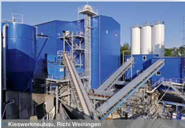
• Kieswerkneubau, Richi Weiningen

Frei Fördertechnik übernimmt für Sie als Generalunternehmer die Umsetzung individueller Gesamtanlagen, kompletter Kieswerke sowie komplexer Aufbereitungsanlagen oder das Optimieren bestehender Infrastruktur.