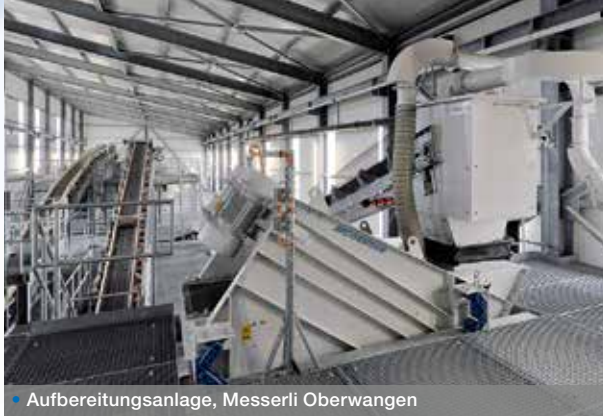
• Aufbereitungsanlage, Messerli Oberwangen

Bei der Realisation Ihrer Anlage für die Förderung von Kies, Split, Stein oder Sand achten wir genauestens auf Merkmale wie Individualität, Wirtschaftlichkeit und Funktionalität. Je nach Rohmaterial wählen wir das geeignete Nass- oder Trockenaufbereitungsverfahren für Sie.