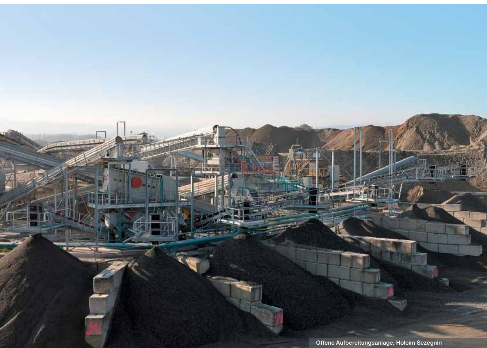
• Offene Aufbereitungsanlage, Holcim Sezegin