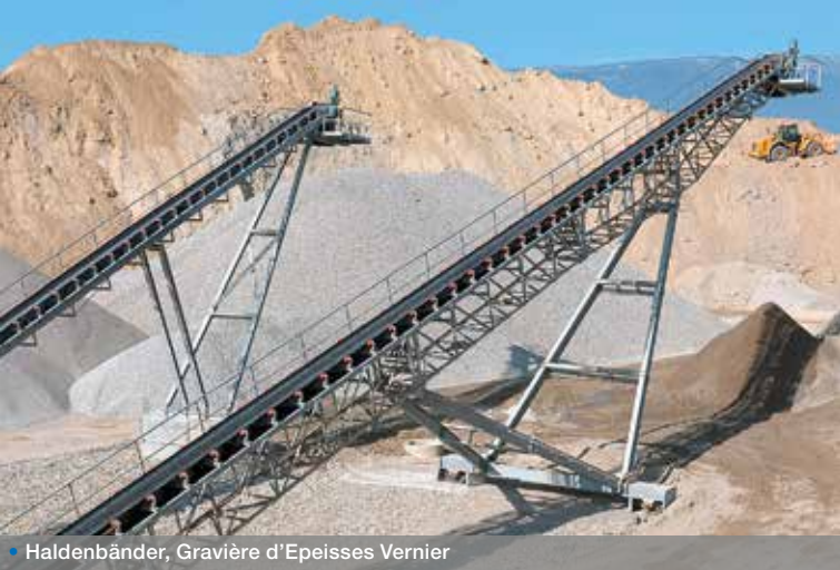
• Haldenbänder, Gravière d'Epeisses Vernier